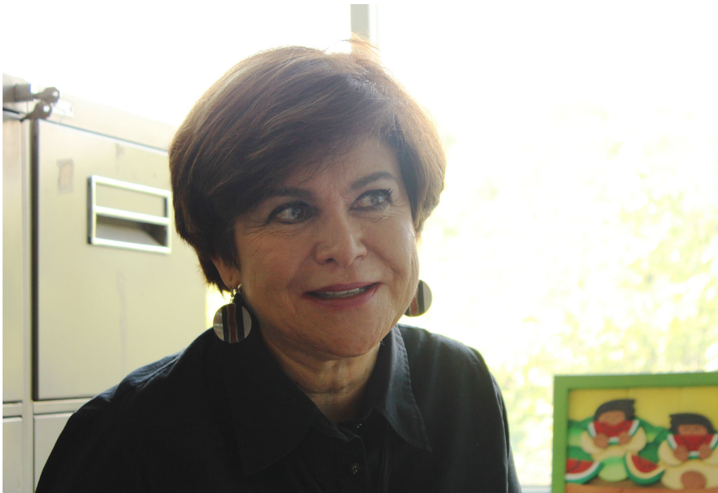
Conocimiento de vanguardia.