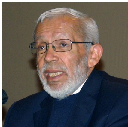
Miguel Ángel Granados Chapa