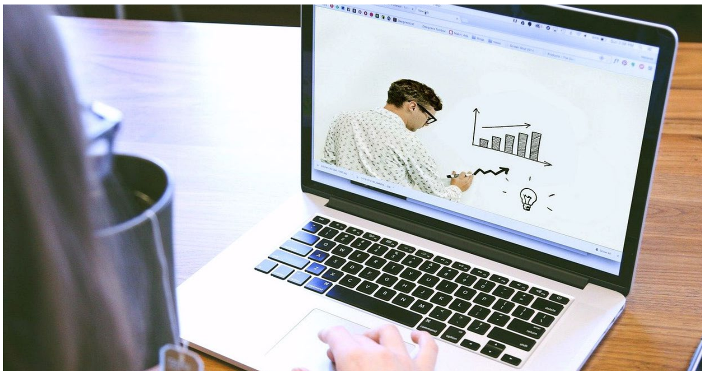
Por la pandemia, las dinámicas de enseñanza cambiaron.

“ La educación se volverá híbrida, configurándose con las necesidades de cada materia y cada forma de enseñanza. ”